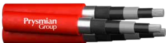
ARE4H5EX 3x (1x185) mm 2 12/20 kV CPR Fca